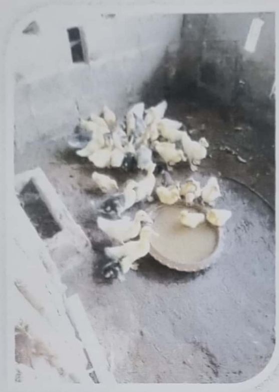
เลี้ยงเป็ด